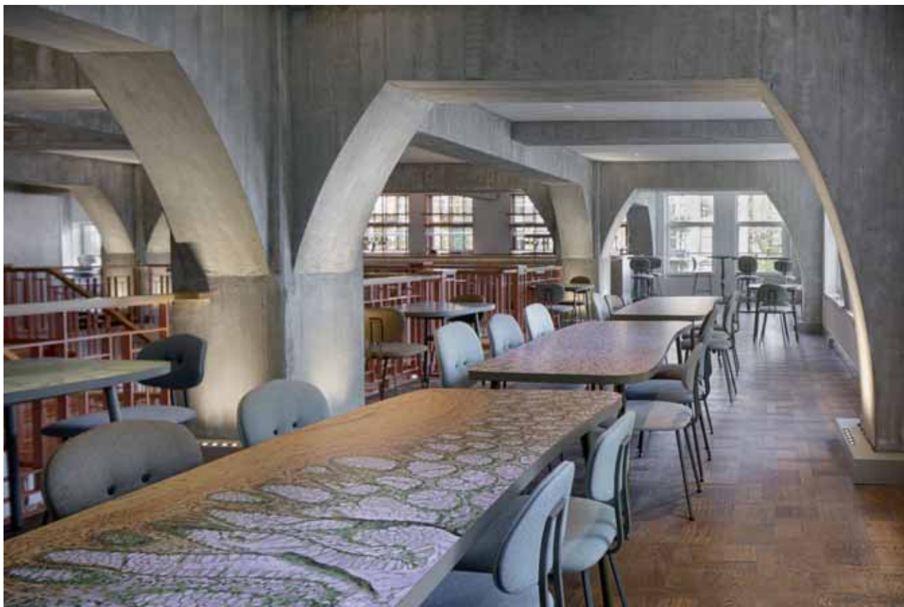
FOTO ONDER De lichtinstallatie van ontwerper Rick Tegelaar boven de trap naar Capital Kitchen.

FOTO BOVEN De bovenverdieping van Capital Kitchen.